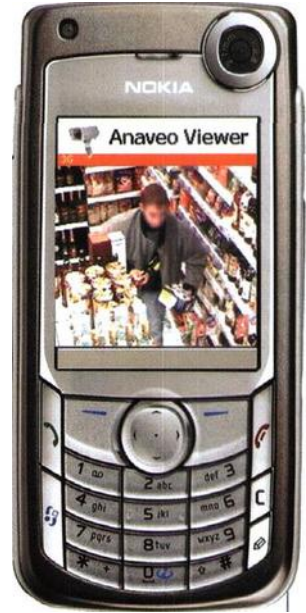
Vol d'une bouteille de Whisky en direct sur un Nokia 6680

Le monde de la vidéosurveillance est unanime : le nomadisme est son avenir, qui plus est à notre époque d'exigence de sécurité des biens et des personnes. Et posséder le don d'ubiquité, ce vieux rêve de l'homme, n'est pas un luxe : une webcam d'excellente facture ne coûte que 80 euros, une caméra IP 150, auxquels s'ajoutent 2 euros par mois et par caméra pour le